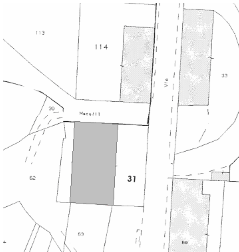
Stralcio di mappa catastale